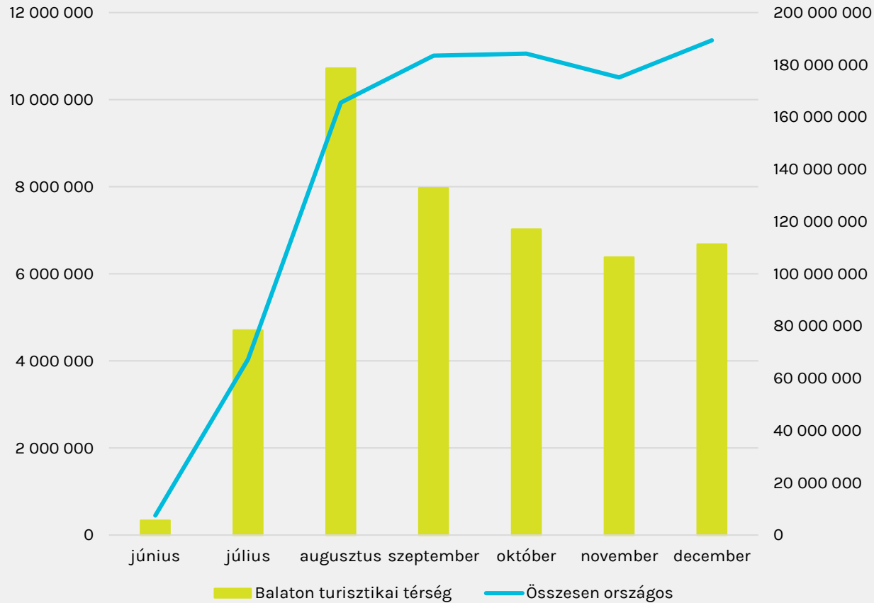
Havi visszaváltási mennyiség (darab)